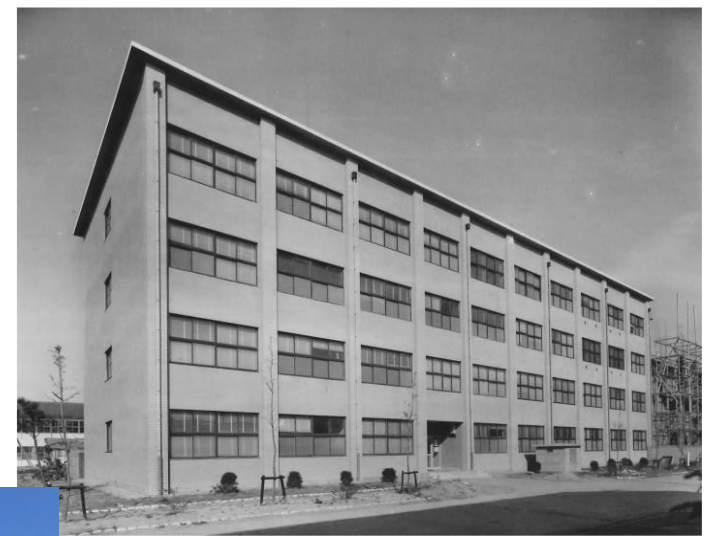
昭和38年～39年設立当時の計測棟