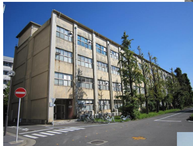
平成22年頃の計測棟