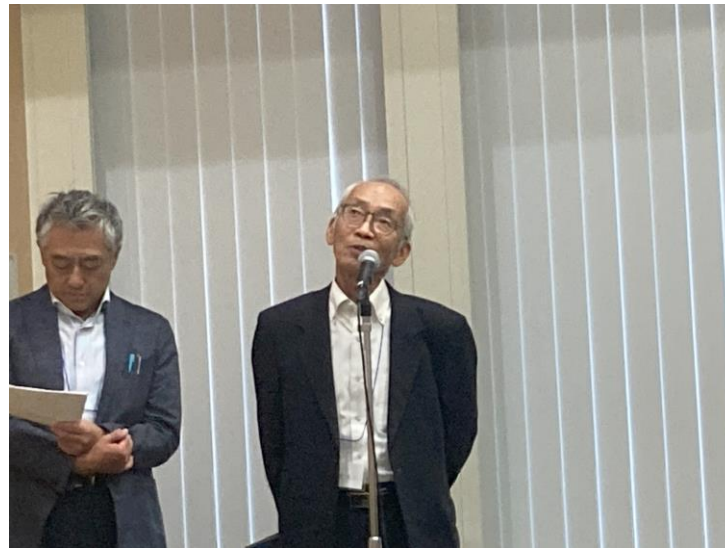
大鹿さんから感想