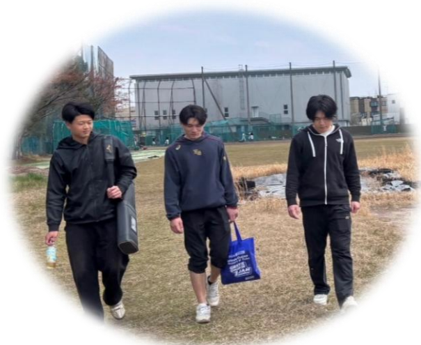
千種グラウンドで最後のキャッチボールを終えて

そして3月26日、卒業式の会場（鶴舞公会堂）へ。「どこかにいるはず」と探しましたが、お目当ての3人には会えず…。