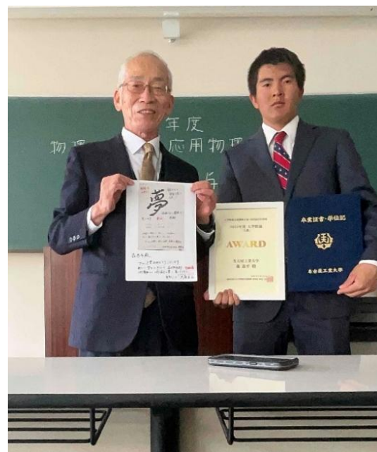
AWARD 賞受賞の森君とのツーショット