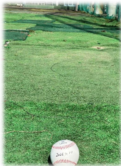
春リーグの大同大グラウンド

もっとも、卒業したはずなのに、なぜかグラウンドの様子が気になってしまうあたり、どうやら“完全卒業”にはもう少し時間がかかりそうです（笑）。